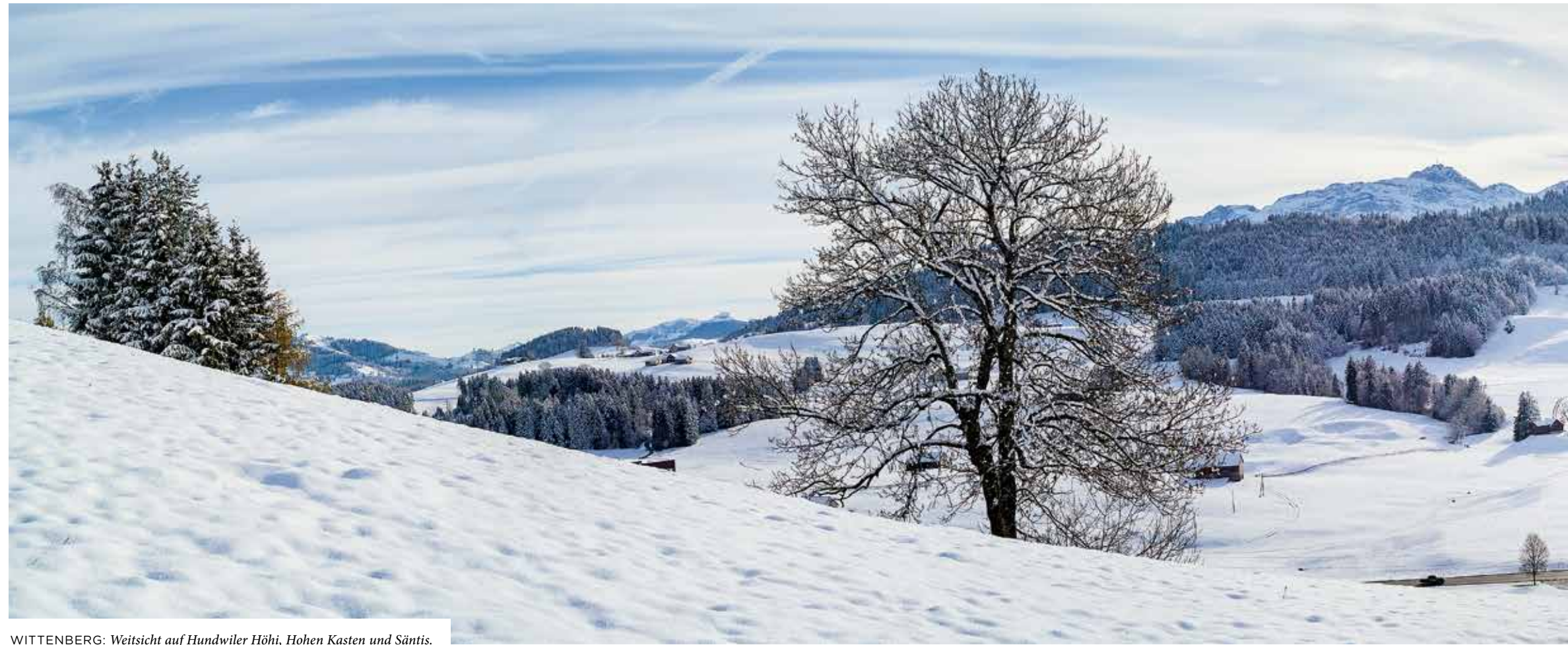
WITTENBERG: Weitsicht auf Hundwiler Höhi, Hohen Kasten und Säntis.