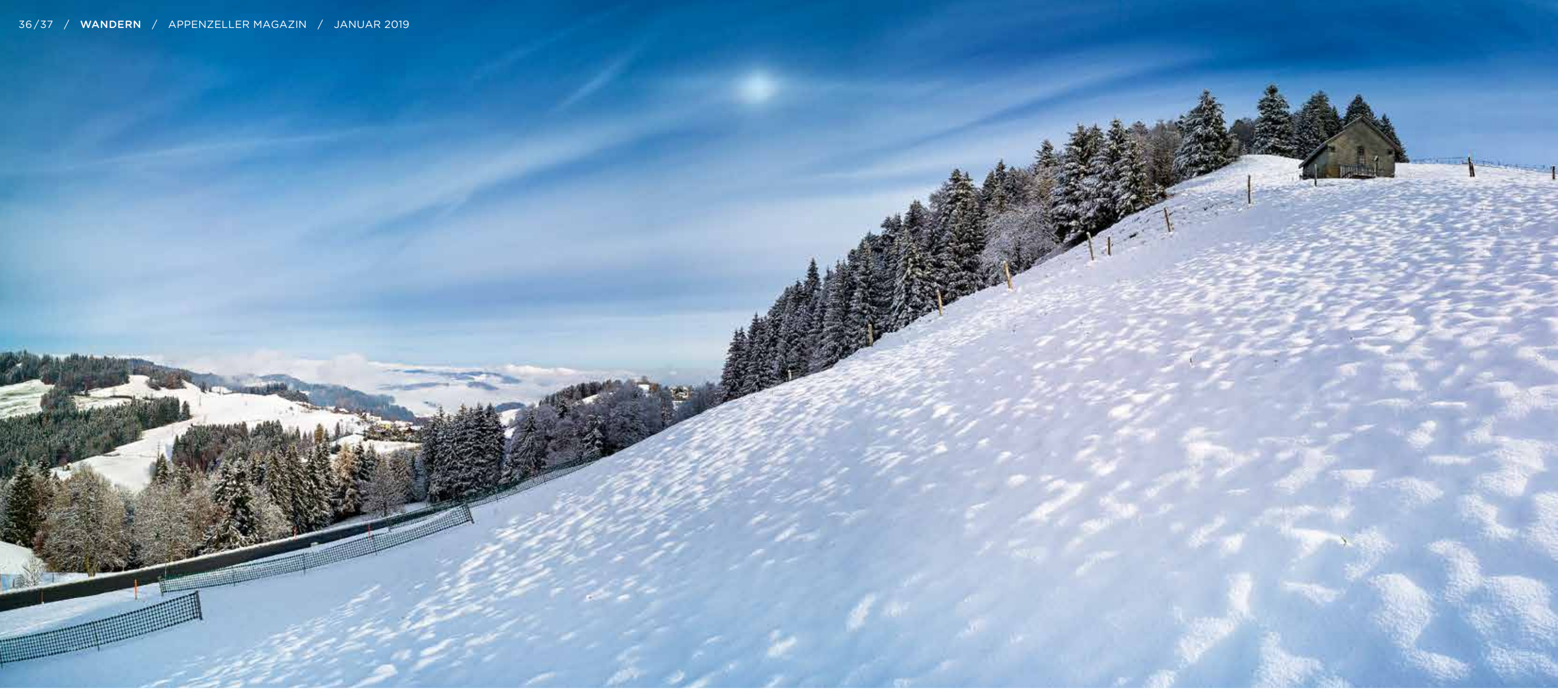
VORDERE RISI: Der Risiwald ist frisch verschneit, und hinter dem Schwellbrunner Sommertal schlängelt sich der Nebel um die Hügel.