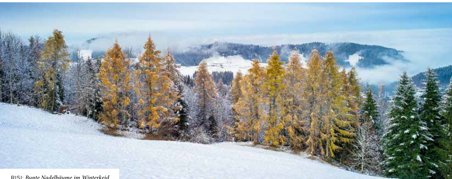
RISI: Bunte Nadelbäume im Winterkeid.