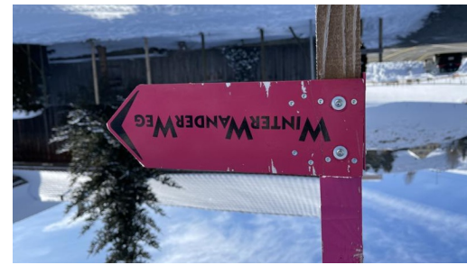
Winterwanderwege Urnäsch - Start