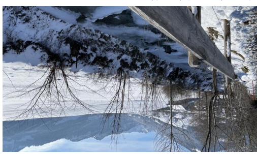
Winterwanderweg Urnäsch - Aussicht