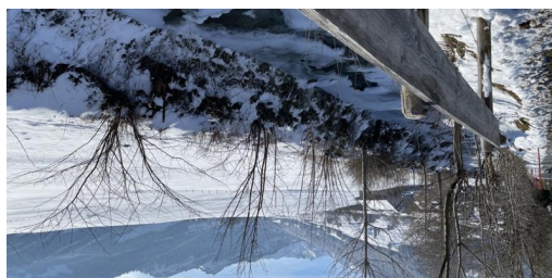
TOP Urnäsch entdecken Winterwandern