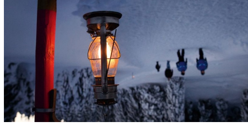
TOP Laternliweg Schwägälp