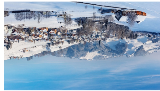
Sicht auf die verschneite Gemeinde Gais